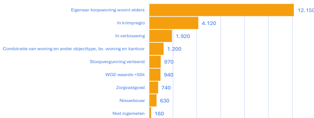
Figuur 3. Mogelijke verklaringen structurele leegstand na energiecorrectie, in aantallen woningen die aan één of meer verklarende kenmerken voldoen

Hiermee geef ik invulling aan de toezegging aan mevrouw Beckerman over een onderzoek naar verklarende kenmerken bij structureel leegstaande woningen voor het einde van 2024, gedaan tijdens het commissiedebat over ruimtelijke ordening van 2 oktober 2024 (TZ202410-049).