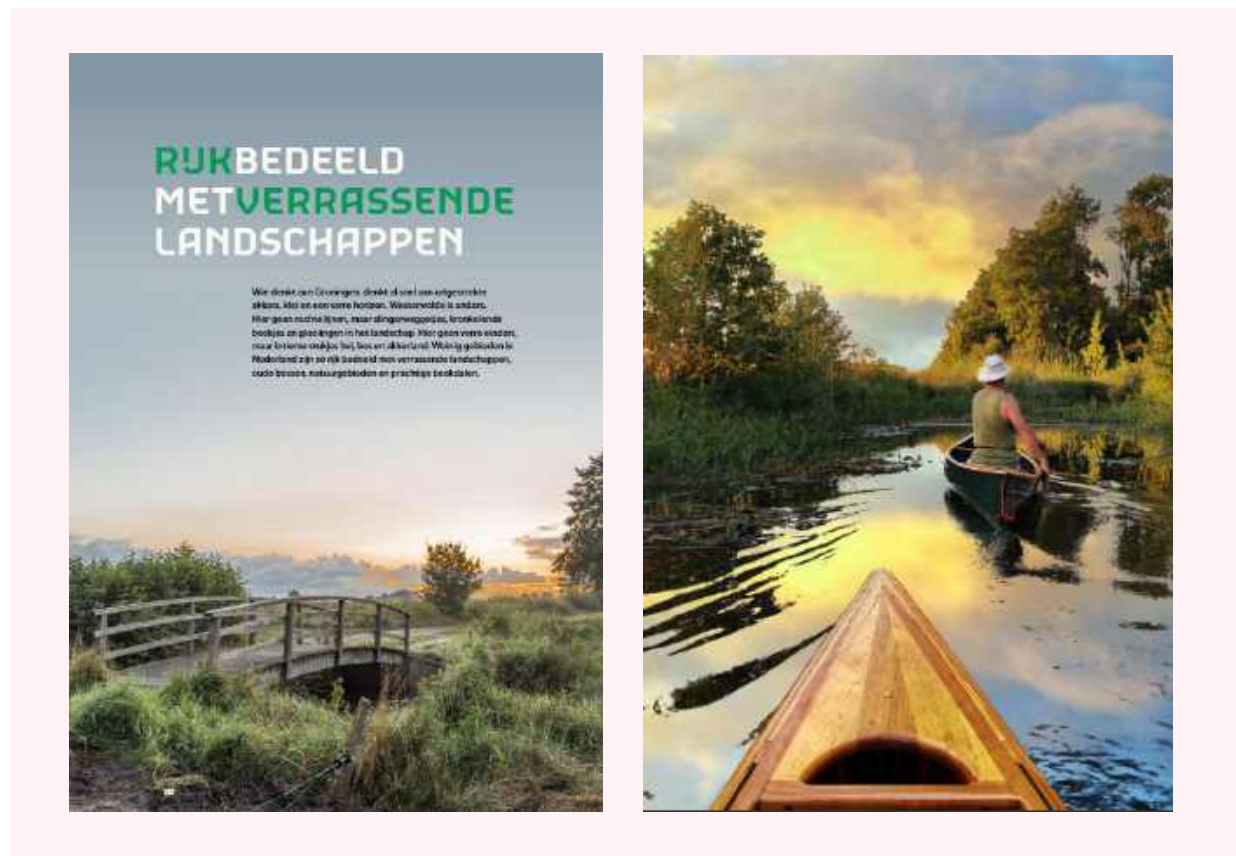
† Twee pagina's uit het Magazine "Bezoek Westerwolde".

“Door heel Nederland hebben wij moeite om onze onderhoudsteams en boswachtersteams in te vullen, behalve hier”.