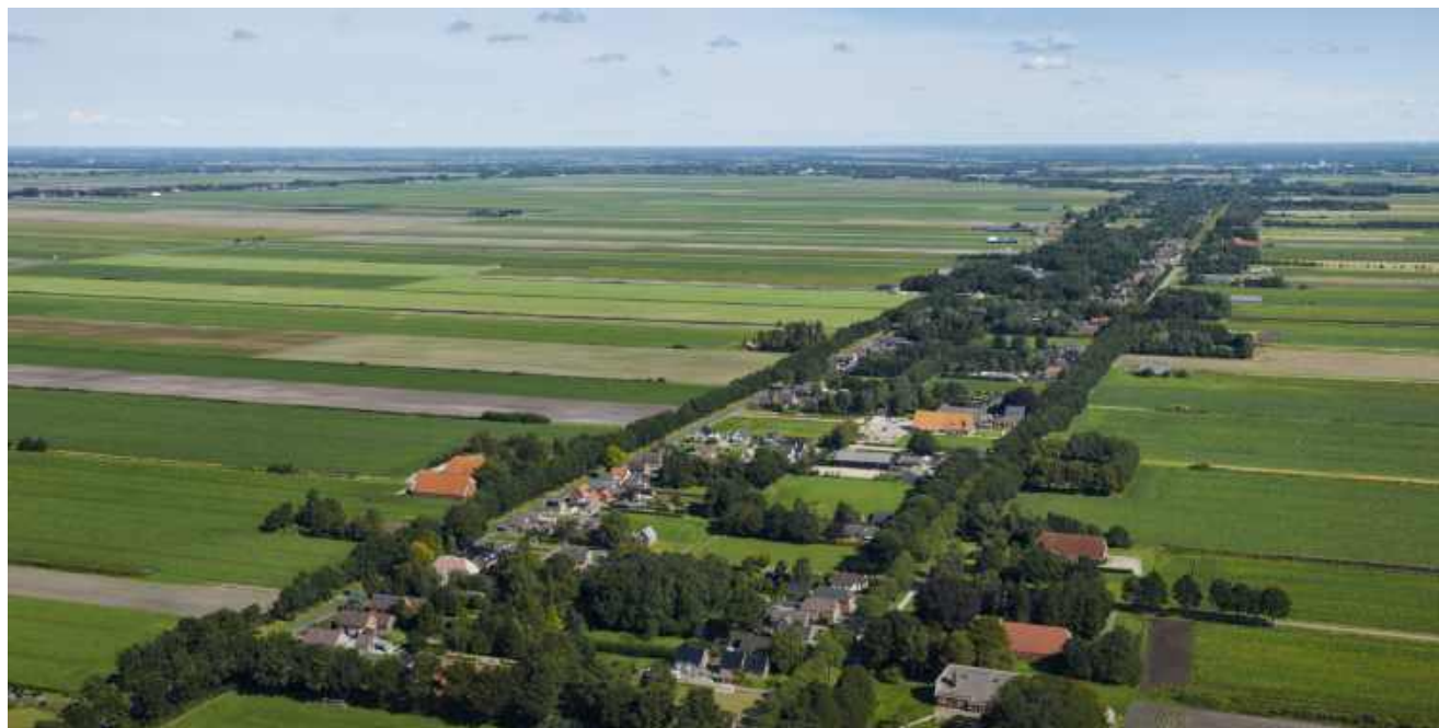
† Veenkoloniaal landschap.

Heel belangrijk is dat mensen heel graag echt mee willen denken en goed meegenomen worden in beslissingen. Omdat de Nedersaksenlijn een bottom-up initiatief is, ligt de voedingsbodem voor een goede samenwerking met de omgeving er al. De verbinding met omgeving moet echter in alle fasen van het MIRT goed opgezocht blijven worden.