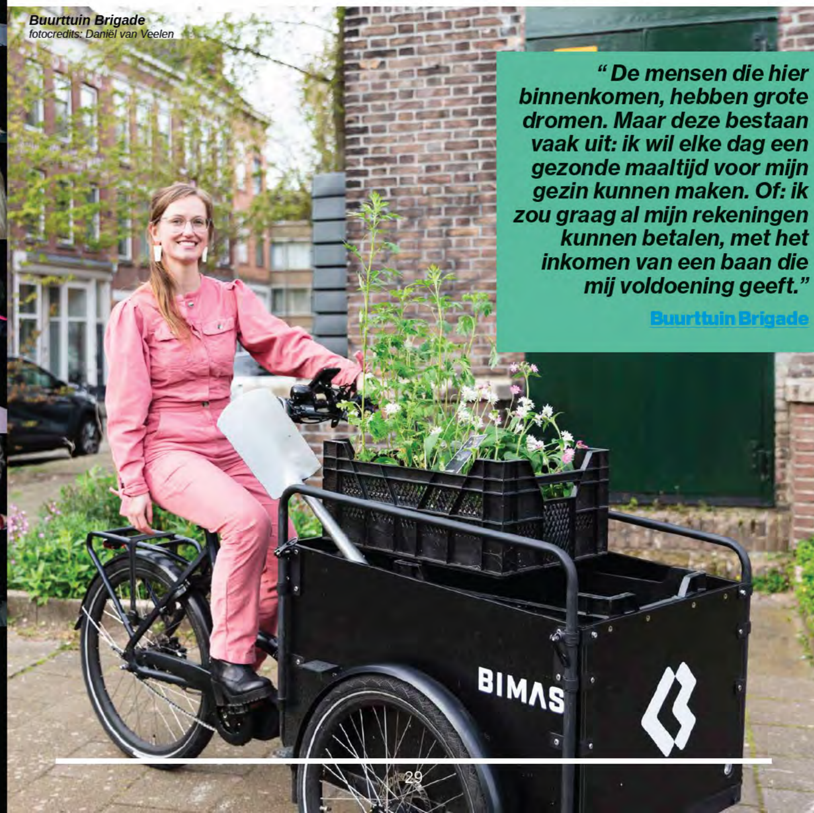
Buurtuin Brigade

"De mensen die hier binnenkomen, hebben grote dromen. Maar deze bestaan vaak uit: ik wil elke dag een gezonde maaltijd voor mijn gezin kunnen maken. Of: ik zou graag al mijn rekeningen kunnen betalen, met het inkomen van een baan die mij voldoening geeft."