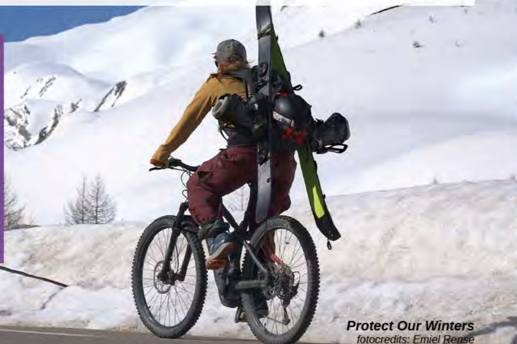
Protect Our Winters

Dus overheid: investeer in initiatieven die mensen informeren en betrekken. Maak dit op alle thema's tot overheidsbeleid. Bij alle campagnes die je als overheid lanceert, van Nationale Klimaatweek tot energiebespaarcampagnes: zorg dat initiatieven de boodschap (nog beter!) kunnen brengen.