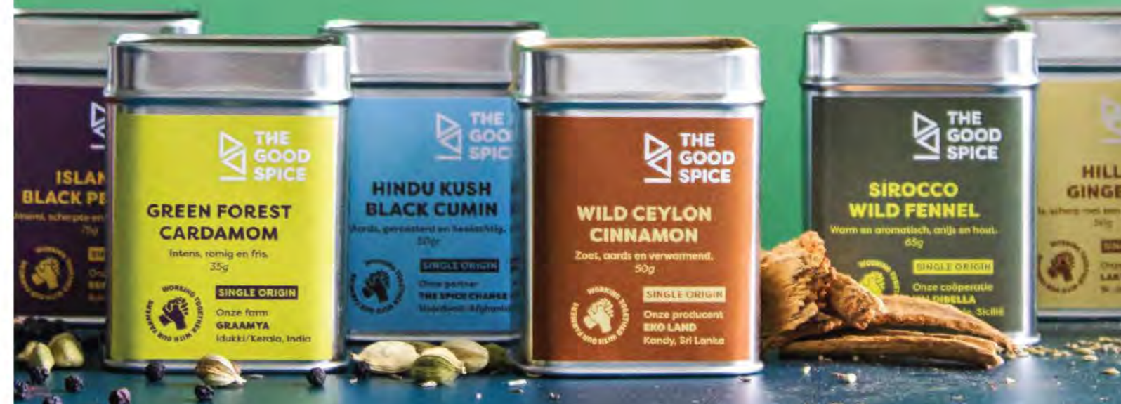
The Good Spice

The Good Spice – korte keten specerijen direct van de boer