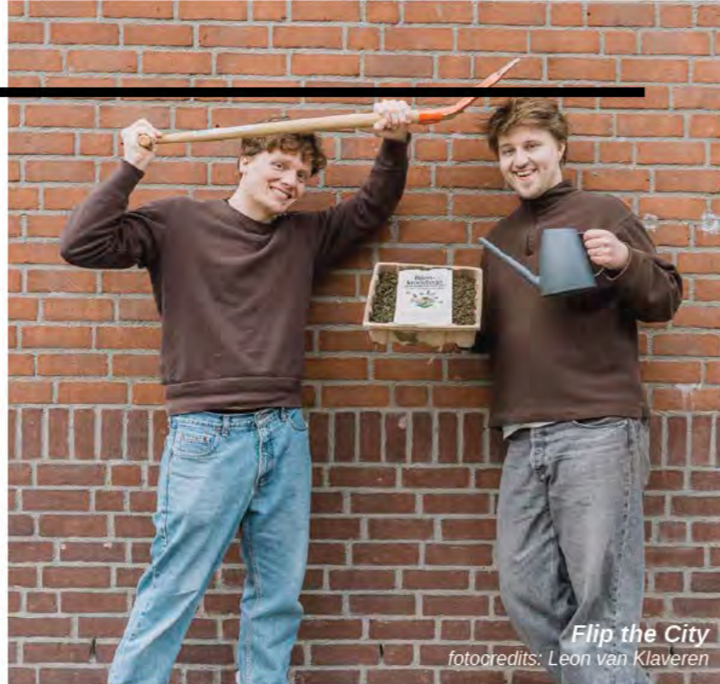
Flip the City

Om 'made in Holland' meer wind in de zeilen te geven helpt meer experimenteerterruimte. Als ergens groene groei zit, dan hier! De R&D afdeling van de samenleving heeft meer investeerders nodig, inkopers met lef, true pricing, CO2 beprijzing en het slimmer maken van regelgeving. Dat laatste ook specifiek in de bouw, rondom energieprestatie en materiaalgebruik (MPG en BENG).