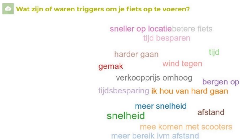
Figuur 1: Triggers woordenwolk groep 1 'van plan om fiets op te voeren'

De deelnemers aan de groepsdiscussies hebben via een online tool hun spontane antwoord gegeven op de vraag: Wat zijn of waren triggers om je fiets op te voeren? De deelnemers aan de individuele gesprekken hebben hier mondeling een antwoord op gegeven. Hierna volgen de woordenwolken van de antwoorden van de deelnemers aan de groepen. Na deze woordenwolken beschrijven we wat de respondenten hier mee bedoelden.