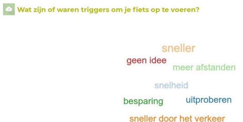
Figuur 2: Triggers woordenwolk groep 2 'hebben fiets opgevoerd'