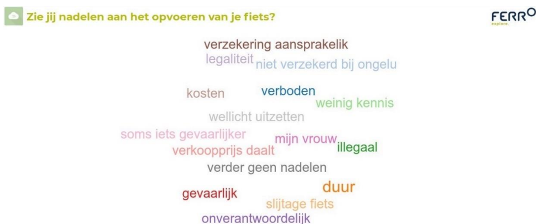
Figuur 4: Barriers woordenwolke groep 1 'van plan om fiets op te voeren'

De deelnemers aan de groepsdiscussies hebben via een online tool ook hun spontane antwoord gegeven op de vraag: Zie jij nadelen aan het opvoeren van je fiets? De deelnemers aan de individuele gesprekken hebben hier mondeling een antwoord op gegeven. Hierna volgen de woordenwolken van de antwoorden van de deelnemers aan de groepen. Na deze woordenwolken beschrijven we wat de respondenten hier mee bedoelden.