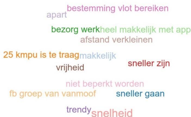
Figuur 3: Triggers woordenwolk groep 3 'hebben fiets opgevoerd'

De triggers zijn als volgt samen te vatten: