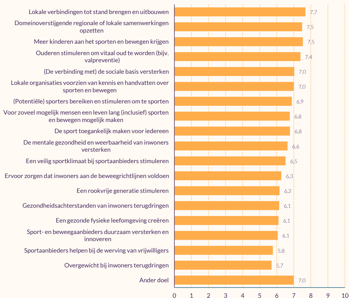
Figuur 4.1 Resultaten* geboekt op de doelen (volgens buurtsportcoaches) (gemiddelden, n=74)

In de panelpeiling hebben we buurtsportcoaches gevraagd naar het resultaat dat zij hebben geboekt op de eerder genoemde doelen (figuur 4.1).