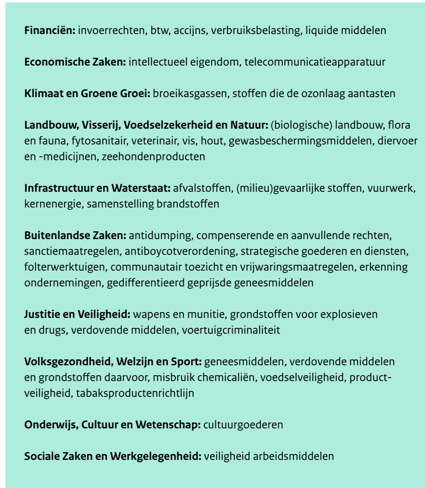
Figuur 1: Opmachtgevende ministeries