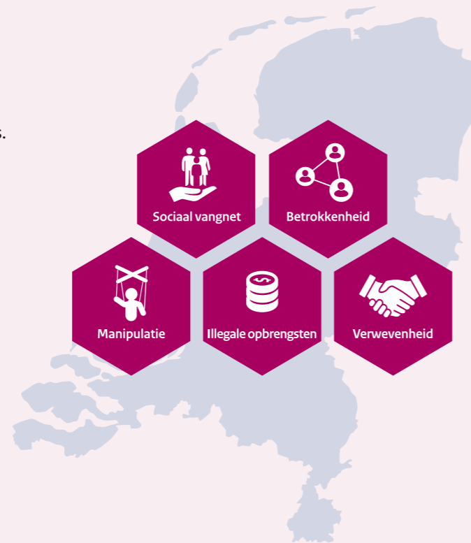
Schematische weergave van de vijf dreigingen voor Nederland

Hieronder volgt een toelichting op de dreigingen. De volledige analyse vindt u in hoofdstuk 7.