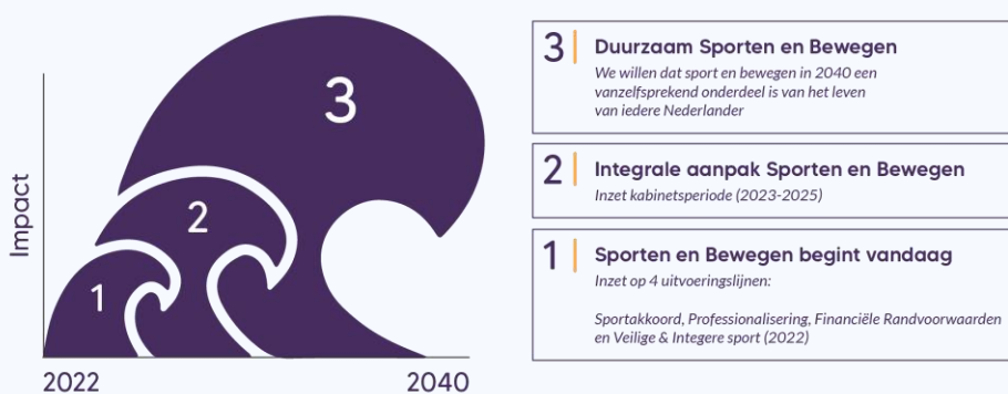
Figuur 1.1 Het Nederlandse sportbeleid in drie golven

Daarnaast ging het om het zetten van accenten in 2023 met de 25 miljoen extra die met het regeerakkoord van het kabinet Rutte IV beschikbaar was gekomen voor het sportbeleid. Ten slotte wilde de minister in de eerste golf voorsorteren op het beleid in de tweede en derde golf.