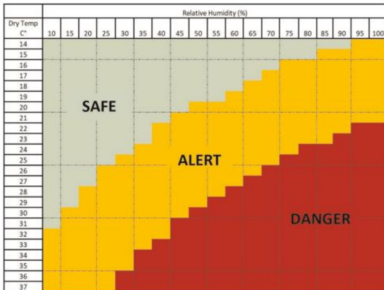
Figuur 2. Thermale zones voor vleeskuikentransport zoals aangegeven door Mitchell et al. (2004, 2005, 2006).