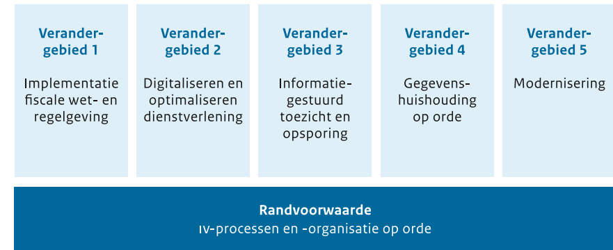
Figuur 1. Vijf iv-verandergebieden en een randvoorwaarde

Samen dekken de vijf verandergebieden af wat in ons iv-landschap moet veranderen om de strategische prioriteiten van de Belastingdienst te realiseren. Deze veranderingen in het iv-landschap vergen ook verbeteringen in de iv-werkwijze en -organisatie. Onder meer om de voorspelbaarheid te verhogen en de beheersing te vergroten. Verbeteringen op het gebied van de iv-werkwijze en -organisatie zijn een randvoorwaarde voor de andere verandergebieden.