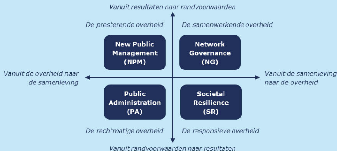
Figuur 2. Het NSOB-model voor overheidssturing.

De horizontale as gaat over sturing; aan de linkerkant van de as stuurt de overheid met name, door het maken van beleid en wet- en regelgeving. Aan de rechterkant van de as komen er met name plannen en initiatieven vanuit de samenleving, zoals bedrijven, maatschappelijke partijen en burgers. De rol van de overheid is getypeerd als de rechtmatige, presterende, samenwerkende en responsieve overheid .