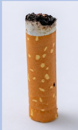
Figuur 1A. Sigarettenpeuk met filter ("filterpeuk")

Ook bij filterloze sigaretten blijft er na het roken een peuk over. Deze bestaat uitsluitend uit de tabakskolom (Figuur 1B). Op basis van de beschikbare informatie is de tabakskolom van een filterloze peuk (tabakspeuk) ongeveer drie keer zo groot als die van een peuk met filter.