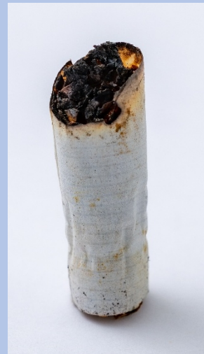
Figuur 1B. Sigarettenpeuk zonder filter ("tabakspeuk")

Op basis van onder andere de Single Use Plastics Directive uit 2019 van de Europese Unie (EU) en het verdrag tegen plasticvervuiling van de Verenigde Naties (VN) worden zowel op Europees als mondiaal niveau maatregelen genomen om plasticvervuiling tegen te gaan [10, 11]. De Wereldgezondheidsorganisatie (WHO) pleit ook voor een