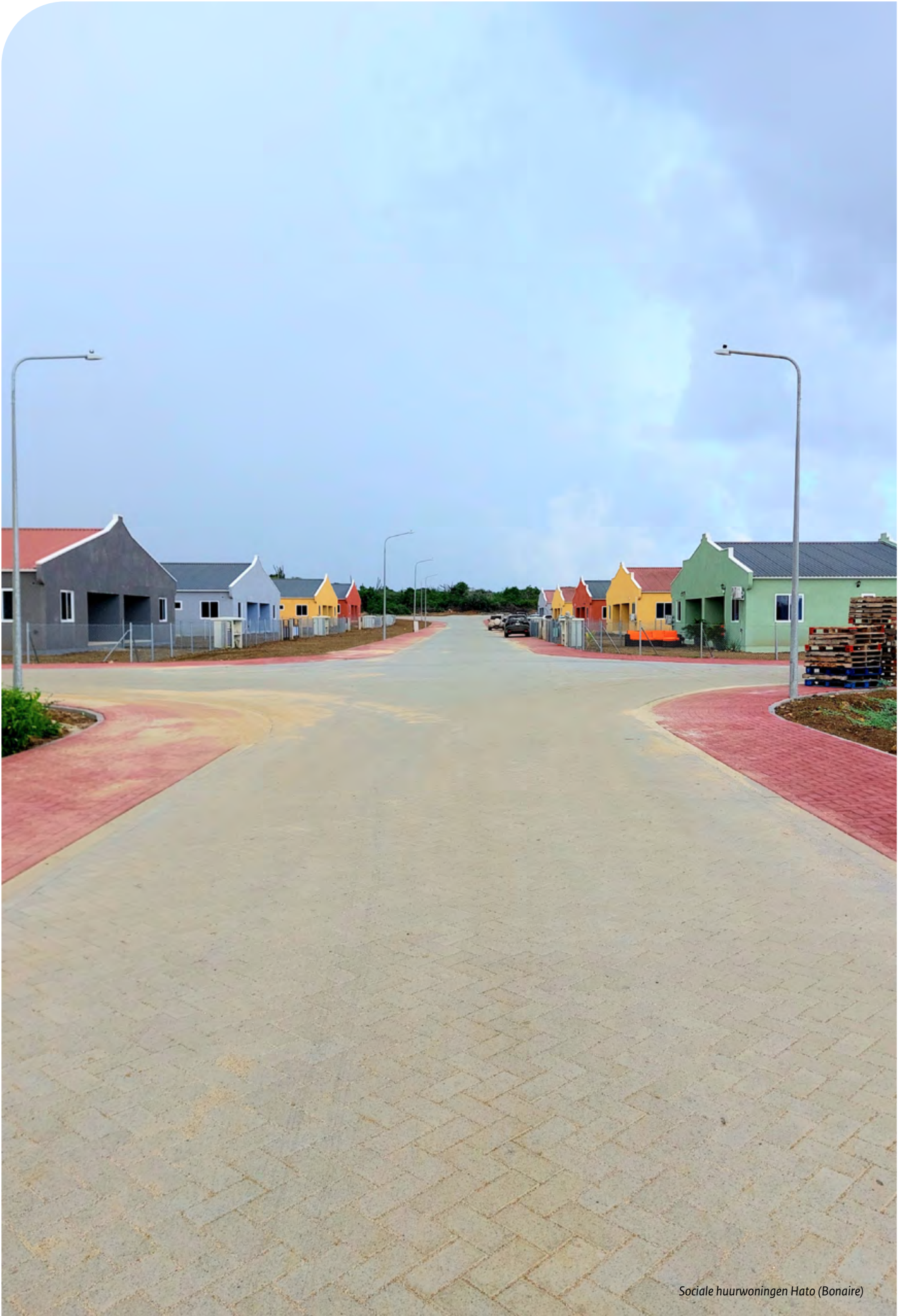
Sociale huurwoningen Hato (Bonaire)