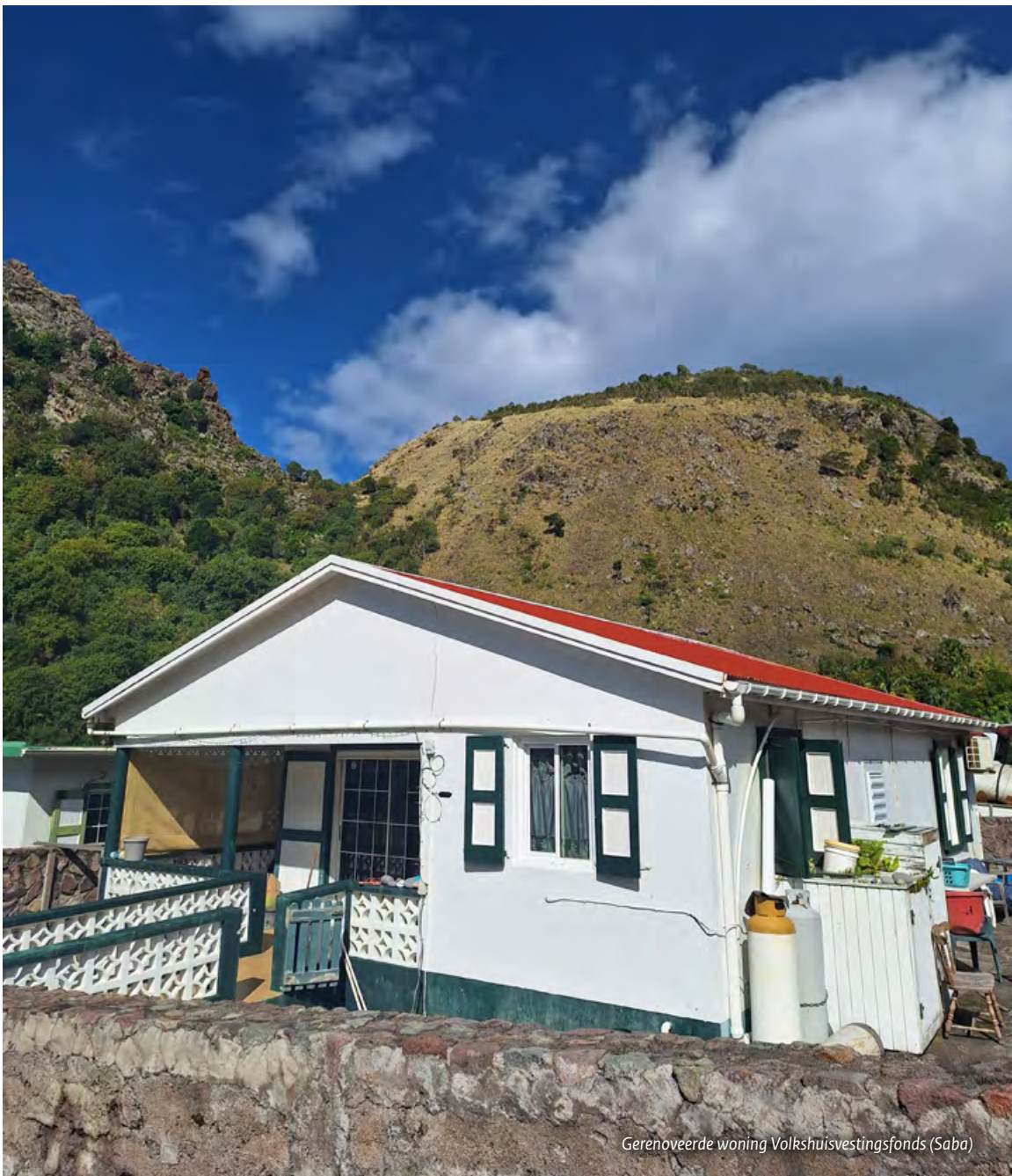
Gereneveerde woning Volkshuisvestingsfonds (Saba)

aantal weeswoningen opknappen in The Bottom, waardoor de woningvoorraad wordt vergroot. Verder zal OLS, waar mogelijk op weesgronden, een woonfunctie realiseren. Ook zullen ruimtelijke verbeteringen worden aangebracht, zoals meer groen en trottoirs. Tot slot is een lokaal fonds opgezet om koopwoningen van kwetsbare huishoudens te bestendigen tegen extreme weersomstandigheden, zoals orkanen. In 2025 zijn vanuit dit fonds 10 woningrenovatieprojecten afgerond, waarmee is geïnvesteerd in een veilige leefomgeving. Er is nog ongeveer een derde van de bijdrage over om lopende projecten af te ronden.