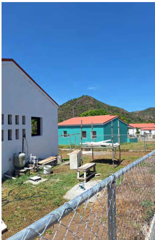
Gerenevoerde sociale huurwoningen (Sint Eustatius)

Sint Eustatius wil de energiearmoede aanpakken. Het ministerie van BZK/VRO heeft in 2022 €450.000 aan Sint Eustatius beschikbaar gesteld tot en met 31 december 2025, met een verlenging van de looptijd tot en met 31 december 2027. Sint Eustatius zet deze middelen met name in voor de verlaging van de energiekosten bij huishoudens met een sociale huurwoning. Hiervoor worden op elke sociale huurwoning vier zonnepanelen geplaatst, waarmee overdag energie wordt opgewekt. In 2025 zijn op 37 woningen zonnepanelen geïnstalleerd. Om de zonnepanelen te plaatsen is renovatie van de sociale huurwoningen (zie actielijn 2) noodzakelijk.