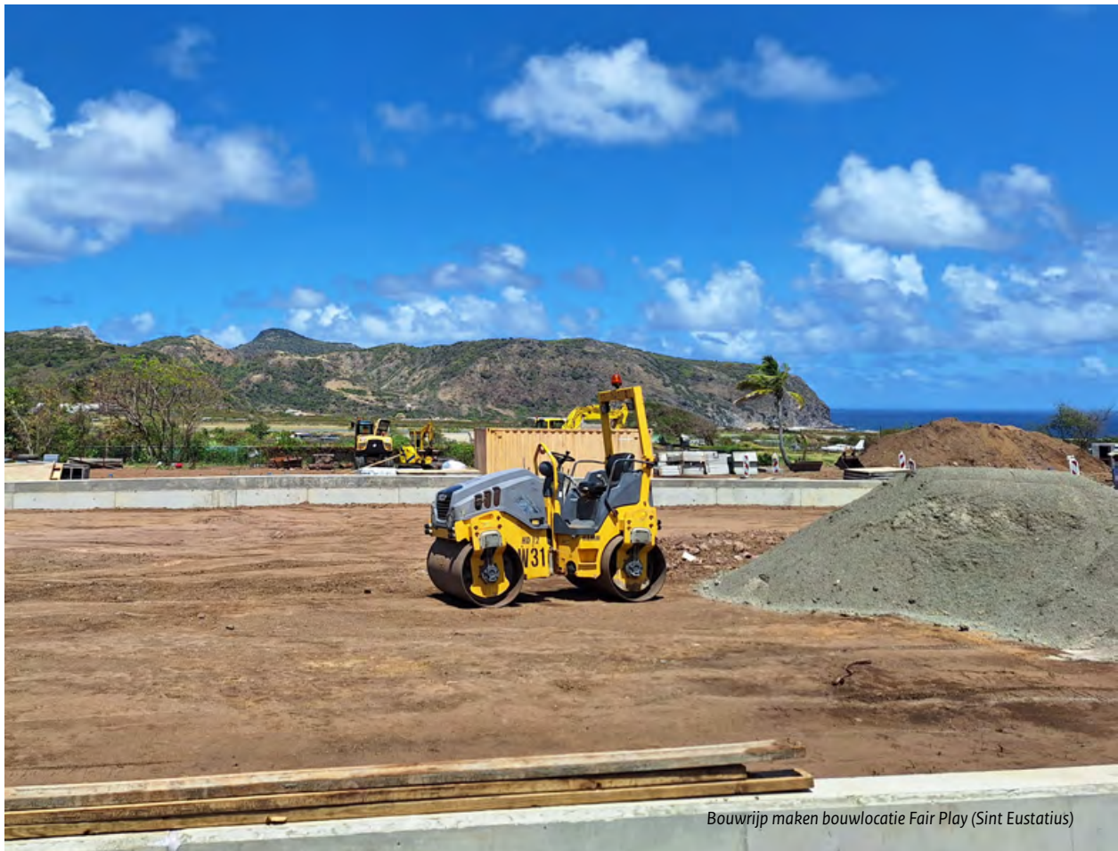
Bouwrijp maken bouwlocatie Fair Play (Sint Eustatius)

Voor het ontsluiten en bereikbaar maken van 95 woningen, investeert het OLE €10.578.974. Deze middelen dragen bij aan veilige en duurzame bereikbaarheid van nieuwe woningbouwlocaties. Het OLE heeft in 2025 een WoKT-aanvraag ingediend voor een Rijksbijdrage van €5.970.000 en deze is toegekend.