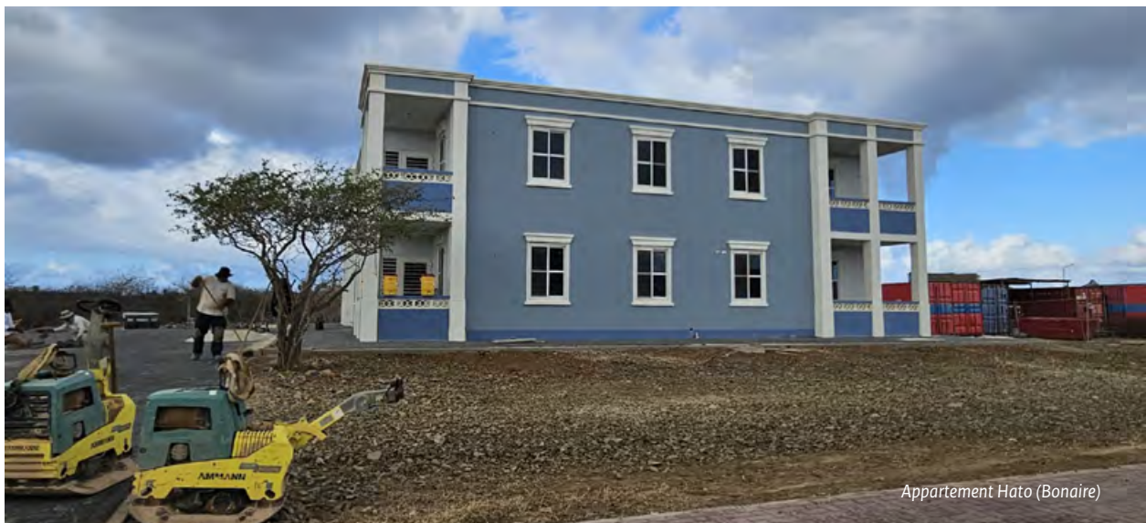
Appartement Hato (Bonaire)

Het OLB is in 2025 begonnen met het opstellen van een ruimtelijke structuurvisie. Deze visie wordt binnenkort door de Eilandsraad vastgesteld en vormt de basis voor de herziening van het uit 2010 daterende Ruimtelijk Ontwikkelingsplan Bonaire (ROB). De planning is om deze herziening in 2026 in concept af te ronden. De uitgangspunten van het Ruimtelijk Ontwikkelingsprogramma Caribisch Nederland (ROCN), dat in juni 2024 door de ministerraad is vastgesteld, worden hierin meegenomen. Zowel de structuurvisie als de herziening van het ROB worden besproken in de Stuurgroep fysieke leefomgeving Bonaire. Ook andere relevante ontwikkelingen worden daar besproken.