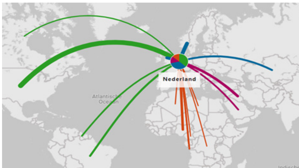
Figuur 2 Importstromen olie naar Nederland 12

Voor olie is Nederland vrijwel geheel afhankelijk van import, voor het overgrote deel van buiten de EU. De invoer van ruwe olie kent daarentegen wel een grote diversiteit aan geografische oorsprong, transportmodaliteit en leveranciers. Belangrijkste herkomstlanden voor olie zijn momenteel onder andere de Verenigde Staten, Noorwegen, het Verenigd Koninkrijk en Irak. De import uit Rusland is de afgelopen tijd snel afgebouwd.