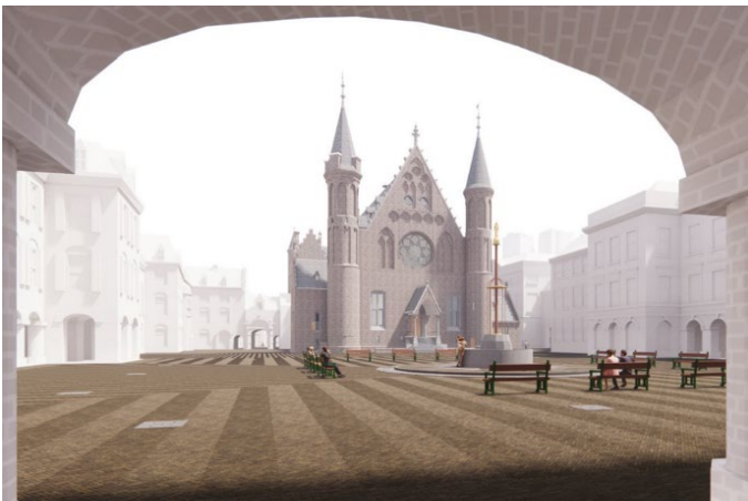
3. Concept ontwerp Opperhof. Beeld: Karres en Brands

In samenwerking met de architect van gebouwdeel TK wordt gewerkt aan het definitieve ontwerp voor de Hofplaats rondom de nieuwe publieksentree. Het ontwerp is een ensemble van nieuwe en bestaande bomen, groene eilanden met gevarieerde beplanting en zitelementen.