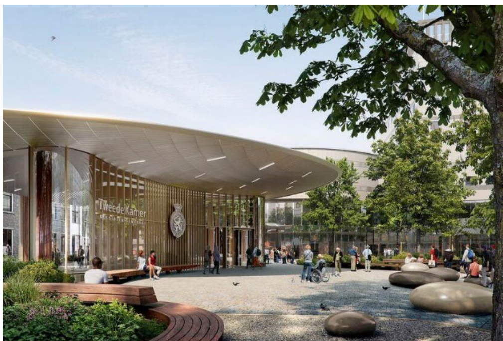
2. Publieksentree Tweede Kamer.

Zoals in de vorige rapportage aangegeven zal eind 2023 de voor de entree benodigde omgevingsvergunning worden aangevraagd. De omgevingsvergunningen van de bestaande gebouwdelen waren al aangevraagd. De vergunning voor de niet monumentale gebouwdelen is op 17 april 2023 afgegeven en die voor de monumentale gebouwdelen is 21 augustus 2023 verleend. Voor de laatste loopt de beroep- en bezwaartermijn tot begin oktober.