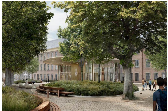
4. Publieksentree Tweede Kamer.