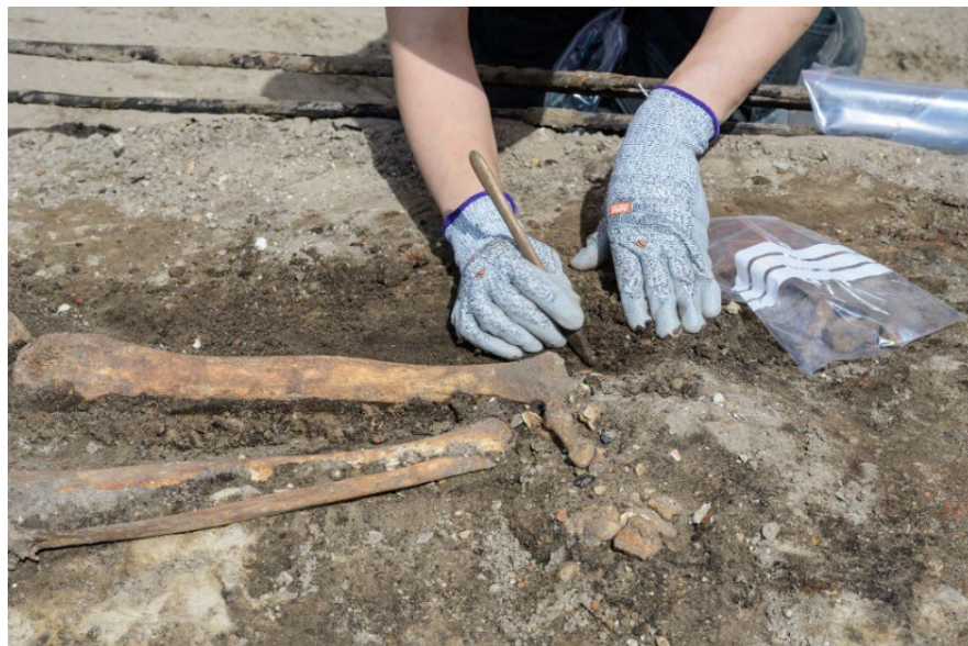
5. Archeologische opgravingen Opperhof

Daarnaast was het mogelijk om het archeologisch onderzoek naar de bodem onder het gesloopte deel van de Hofkapel uit 1879 naar voren te halen in de planning. Dit onderzoek is begin juli gestart. Het betreft de aanbouw uit de vijftiende eeuw (zijkapel) en een galerij uit de zestiende eeuw. Het project is dankzij het gebruik elektrische hulpmiddelen emissievrij uitgevoerd.