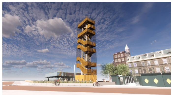
7. Impressie van het uitzichtpunt.