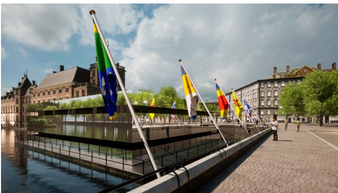
6. Impressie van de bouwkeet.