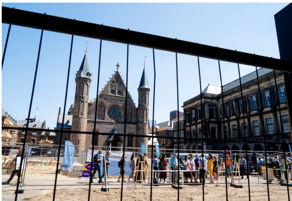
1. Ridderzaal, dag van de Bouw