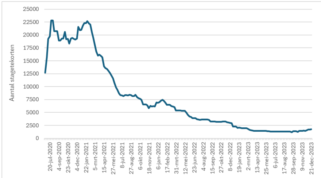
Figuur 1. Ontwikkeling van tekorten aan stages en leerbanen van 10 juni 2020 tot en met 31 december 2023 1

In juli 2020 werd het hoogste aantal absolute tekorten gemeten, met in totaal een tekort van 22.803 stageplekken en leerbanen, gevolgd door een piek van 22.678 tekorten eind januari 2021. Vanaf februari 2021 namen de tekorten gestaag af. Deze daling valt samen met de versoepelingen van de coronamaatregelen. Met de steeds verdere versoepeling van de coronamaatregelen en de intensieve samenwerking tussen leerbedrijven, onderwijsinstellingen en SBB bij de aanpak van tekorten zagen we het aantal tekorten tussen maart 2021 en juli 2021 sterk dalen.