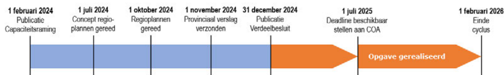
Figuur 1. Fasering en mijlpalen eerste cyclus spreidingswet

In deze paragraaf volgt een analyse van de specifieke fases en mijlpalen binnen de wetscyclus, waarbij de diverse fases/mijlpalen chronologisch worden behandeld.