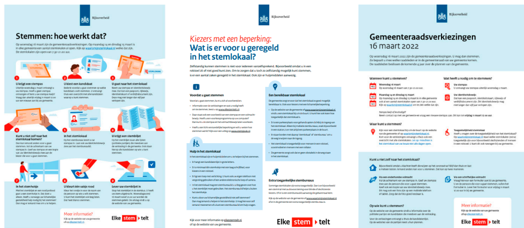
Screenshot van voorbeelden van de maatwerk-communicatiemiddelen

Sommige gemeenten hadden de communicatie die werd bijgevoegd bij de stempas en/of kandidatenlijst al geproduceerd en verspreid voordat de versoepelingen bekend werden. De kiezers in die gemeenten ontvingen bij hun stembescheiden dus niet de meest actuele informatie over de geldende coronamaatregelen. Aan alle gemeenten is gevraagd om aan de gewijzigde maatregelen extra aandacht te besteden in de communicatie aan de kiezer.