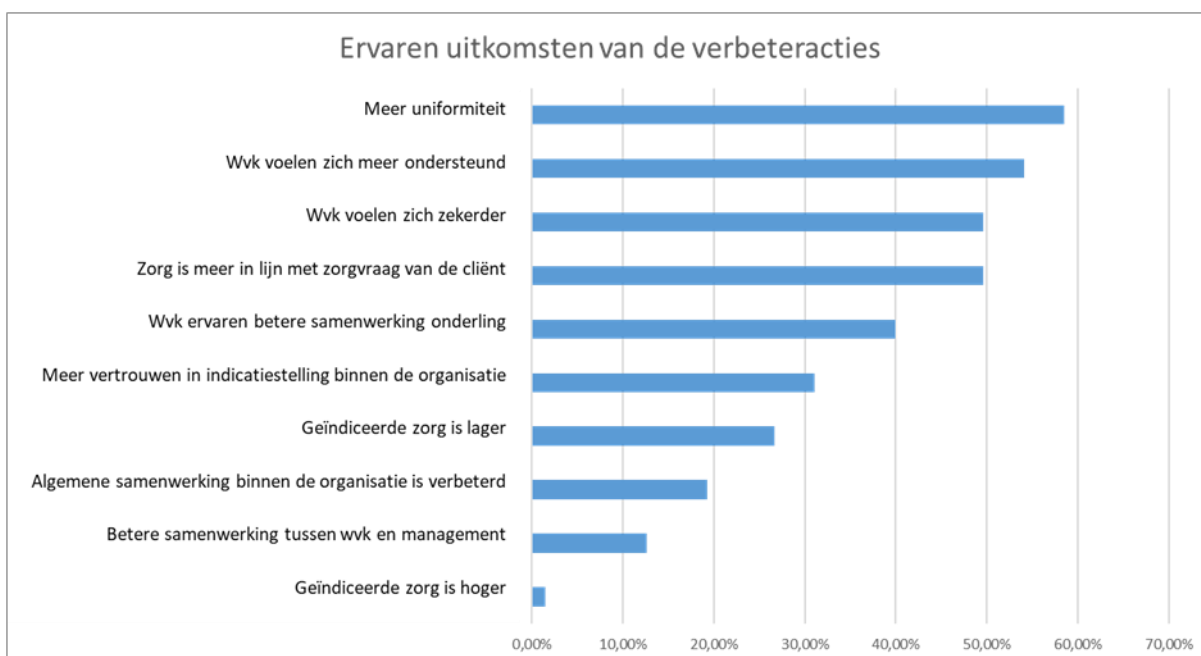
Figuur 3. De ervaren uitkomsten van de verbeteracties