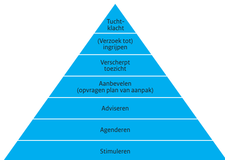
Figuur 1: De interventiepiramide van de IMG

De toezichttaak van de genoemde externe inspecties is in beginsel beperkt tot het Nederlandse grondgebied. De IMG voert ook toezicht uit bij extraterritoriaal optreden. We beschikken over een breed palet aan interventiemogelijkheden, van stimuleren en adviseren tot en met handhaving.