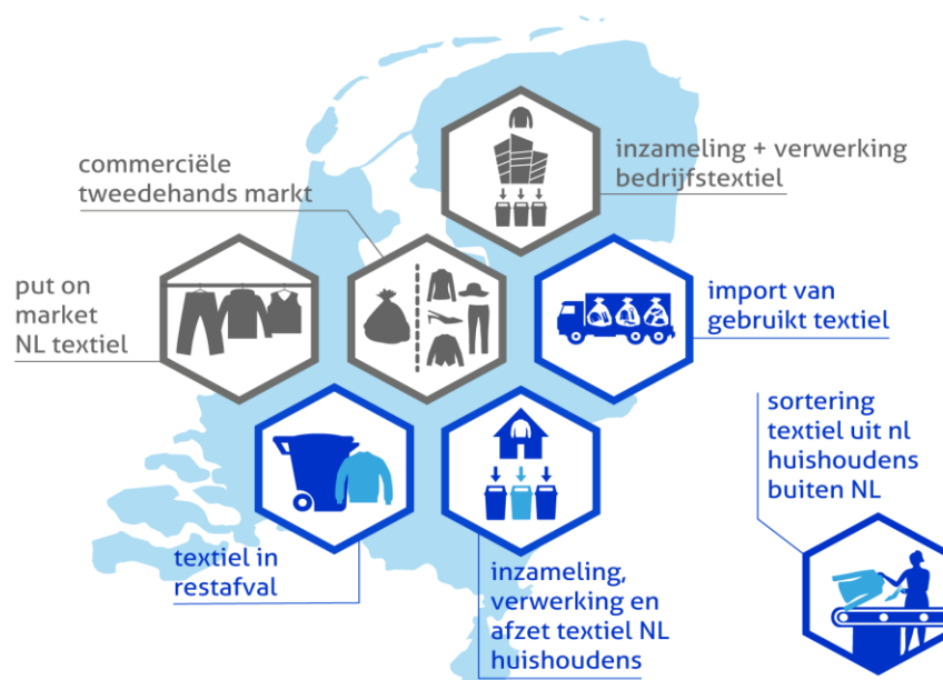
Figuur 1: overzicht van de Nederlandse textielmarkt, blauwe onderdelen zijn onderzocht.

De totale textielmarkt is schematisch weergegeven in figuur 1. De grijs gekleurde onderdelen van de markt vallen buiten de scope van het onderzoek. De in blauw weergegeven onderdelen vallen binnen de scope van het onderzoek.