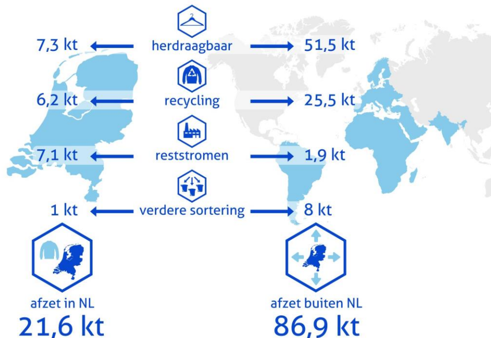
Figuur 3: Massabalans 2022 (gewicht, route) van in Nederland ingezameld afgedankt textiel

In onderstaand figuur is de afzet verdeeld naar binnen en buiten Nederland.