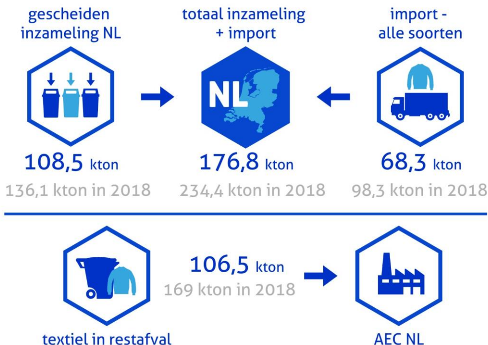
Figuur 2: inzameling en import van afgedankt textiel (boven) en textiel in restafval van huishoudens (onder) in 2022 (blauw) en 2018 (grijs).