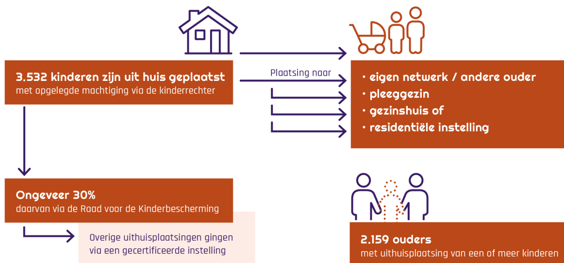
Figuur 2. Infographic van de cijfers van het ministerie van Justitie en Veiligheid

Beide bronnen, het CBS en het ministerie van J&V, leveren verschillende cijfers en bevatten nog veel onzekerheden.