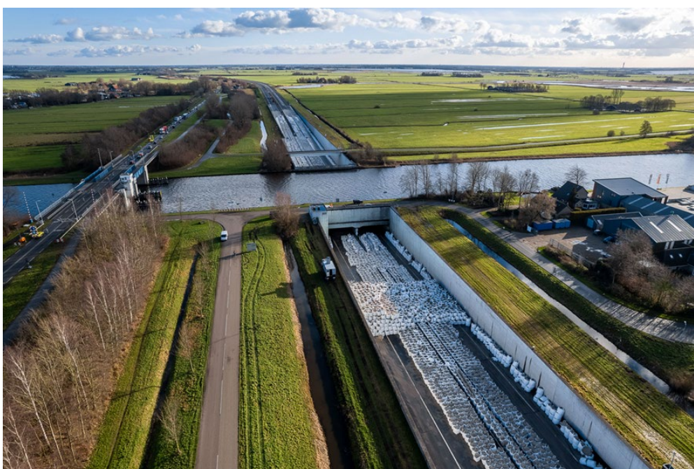
Overzichtsfoto vlak na afsluiten van de Prinses Margriettunnel met ballast (bigbags)