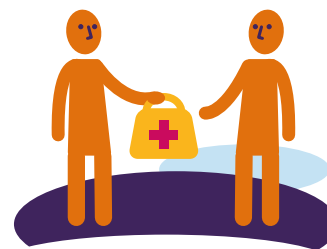
6 Begeleiding en hulp