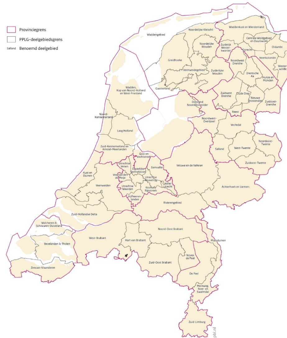
Deelgebieden benoemd in Provinciaal Programma Landelijk Gebied