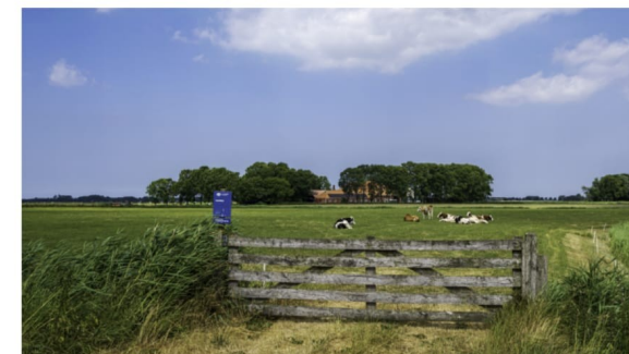
Een weiland met koeien in de voorzomer van 2023, langs het Reitdiep in Groningen.

De provincies willen in gesprek met het rijk over extra landelijke maatregelen vanuit Den Haag. De