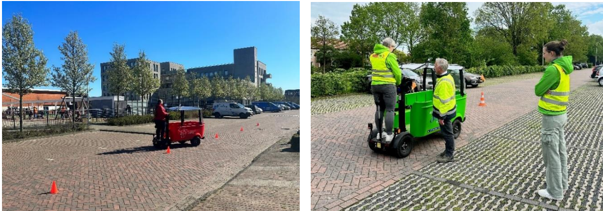
Figuur 5. Praktijktraining BSO bus VVCR-Prodrive en Stichting Veilig door het Verkeer

Beide aanbieders hebben veel aandacht voor de kwaliteitsbewaking van de trainingen. Zo worden de trainingen enkel verzorgd door WRM gecertificeerde trainers, die tevens beoordelen of de deelnemers voldoende competent zijn. Bij beide aanbieders ontvangen de trainers een lesplan, waarin onder andere het doel, de inhoud, de vorm en de wijze van beoordeling van de training is uitgewerkt. De trainers worden intern opgeleid en volgen reguliere bijscholingen. De trainingen worden cyclisch (bijvoorbeeld jaarlijks) geëvalueerd en beide aanbieders worden extern getoetst of zij de certificaten terecht afgeven. De verzekeraar houdt toezicht op de rijtrainingen en beoordeelt de kwaliteit van de training steekproefsgewijs. De verzekeraar ziet 90-95% minder schade en ongevallen bij bestuurders die een BSO bus training gevolgd hebben.