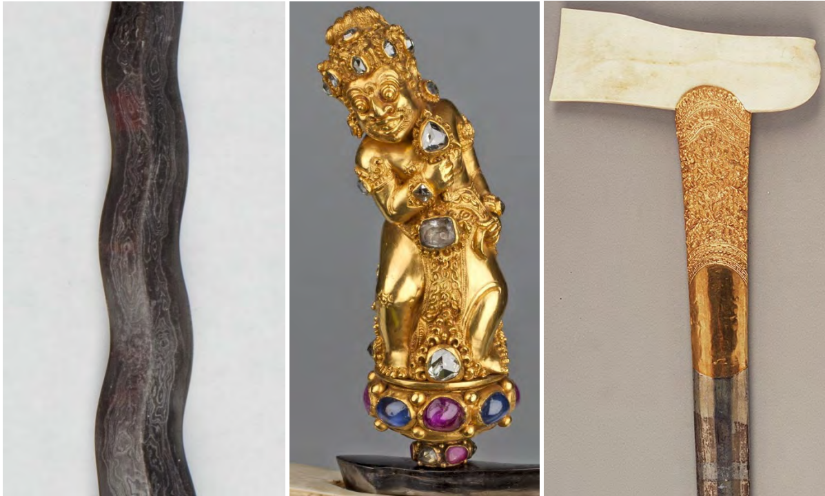
Foto's: Collectie Nationaal Museum van Wereldculturen, obj.nr. RV-3600-193.

krisen wordt meestal de god Bayu afgebeeld op figuratieve Balinese krisgrepen. 5 Naast de greep wijst ook de schede van de kris op een Balinese herkomst. 6 De ivoren schedeopening gaat over in een schede van kayu pelet (gevlekt hout), die aan één zijde is voorzien van een deels vergulde, deels zilveren overschede. Op het vergulde gedeelte is aan de bovenzijde een motief van bloemen en bladranken zichtbaar. Vervolgonderzoek in samenwerking met Indonesische krisexperts zou zich onder meer kunnen richten op het identificeren van de figuur op de greep.