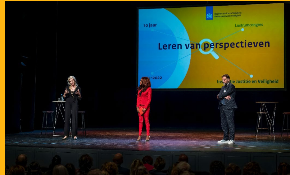
Tweede lustrum congres (oktober 2022)

toezicht vallen. Informatie-uitwisseling kan sterk bevorderd worden door actualisering van wet- en regelgeving over onze taken en bevoegdheden (zie ook hoofdstuk 2). Dit behoeft vooral aandacht bij onderdelen binnen strafrechtketen en het toezicht op de vreemdelingenketen. Het verkrijgen van data is onmisbaar voor goed toezicht.