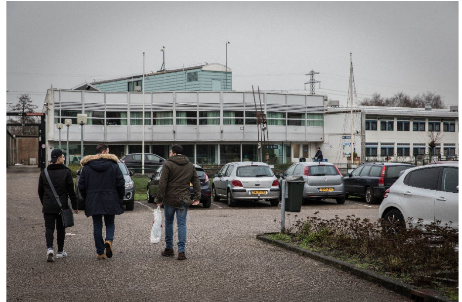
Handavings- en toezichtlocatie Hoogeveen.

bijvoorbeeld in de begeleiding van vreemdelingen met psychiatrische en/of verslavingsproblematiek.