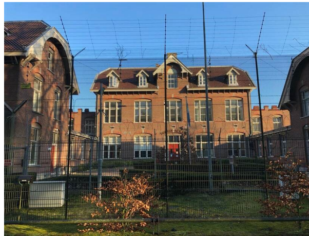
Een Justitiële Jeugdinrichting.

wie (welk deel van) het probleem kan oplossen. We kijken daarbij niet alleen naar de uitvoeringsorganisatie als opdrachtnemer, maar benoemen waar relevant ook de rol van de eigenaar en opdrachtgever. Een problematische taakuitvoering vraagt om een andere manier van werken door de organisaties die onder het toezicht vallen. Bijvoorbeeld door naar andere oplossingen te kijken als het personeel er niet is. Deze andere manier van werken heeft ook geleid tot een andere focus in het werk van de Inspectie en een ander effect. Hieronder wordt dit uitgelicht aan de hand van voorbeelden uit het toezicht op Justitiële Jeugdinrichtingen (JJI's) en de aanpak van de Covid-19 crisis door de veiligheidsregio's.