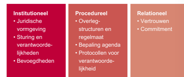
Figuur 1 Schematische weergave van de Cooperative Governance Code van De Greef & Hageman (2017)

Voor dit onderzoek is gebruik gemaakt van het volgende normatieve toetsingskader . In de Code Cooperative Governance , ontwikkeld door Rob de Greef en Maarten Hageman, wordt gesteld dat er drie voorwaarden zijn voor effectieve samenwerking van overheden: de juridische vormgeving moet op orde zijn (duidelijke bevoegdheden en verantwoordelijkheden); de overlegvormen (procedures) moeten doelmatig zijn en moeten met vaste regelmaat en binnen een overzienbare termijn tot besluiten leiden (slagkracht); en op het relationele vlak moet sprake zijn van onderling vertrouwen en blijvende betrokkenheid . Uit dit inzicht hebben de beide onderzoekers vervolgens acht beoordelingsmomenten afgeleid (zie: onderstaande figuur 1) die wij in dit onderzoek zullen hanteren.