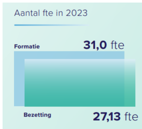
Figuur 2. Formatie en bezetting Huis voor Klokkenuiders in 2023 12

Naast het bestuur, heeft het Huis ook een directeur. Deze is verantwoordelijk voor de dagelijkse leiding van het Huis en geeft leiding aan een bureau van 27,13 fte. Onder dit bureau vallen de medewerkers van de verschillende afdelingen van het Huis. De directeur is in dienst van het Huis. Onderstaande figuur laat zien dat van de totale formatie van 31 fte in 2023 3,87 fte bestond uit nog niet vervulde vacatures. 11