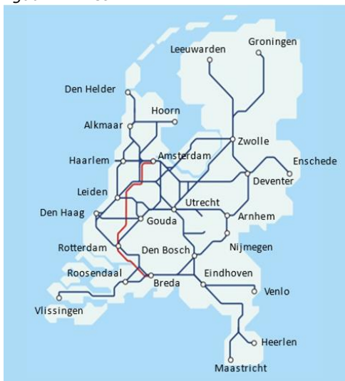
figuur 2 – het HRN

Bovenstaande kaart toont de indeling en omvang van het HRN inclusief de belangrijkste knooppunten en eindstations. Op de blauwe lijn rijden intercity's en sprinters, de rode lijn is de